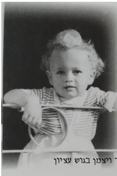
ביקור הנשיא עזר ויצמן בגוש עציון